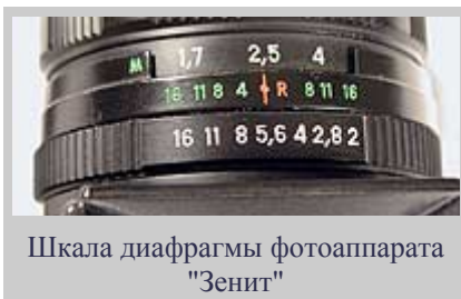
Шкала диафрагмы фотоаппарата "Зенит"

Держатель негатива (Negative Holder) - устройство, предназначенное для фиксации положения негатива в увеличителе в процессе печати или в сканере.