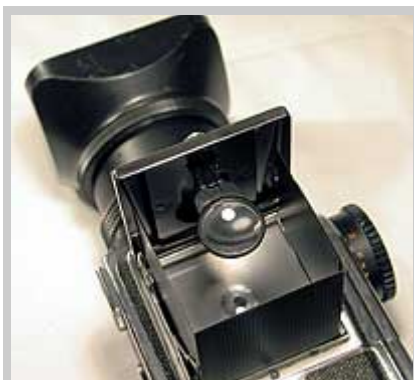
Видоискатель среднеформатной камеры "Киев 88" (ширина пленки 6 см)

Боковая подсветка - свет, падающий на объект в направлении, перпендикулярном направлению "объектив-объект"; создает тени и света, придающие рельефность объекту (моделирующий свет).