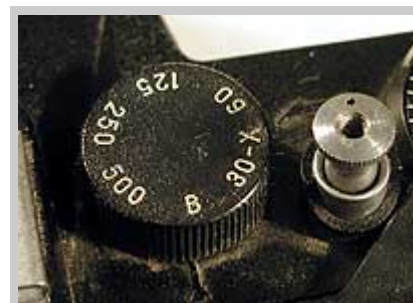
Переключатель выдержек фотоаппарата "Зенит"

Выдержка - промежуток времени, на который открывается затвор фотоаппарата и пропускает к пленке прошедший через объектив световой поток. Измеряется в секундах - 1, 2, 4 сек. или ее долях, обозначаемых в виде дроби: 1/30, 1/60, 1/125, 1/500, 1/1000 сек и так далее. В обиходной речи обычно называют только знаменатель дроби. Чем больше знаменатель,